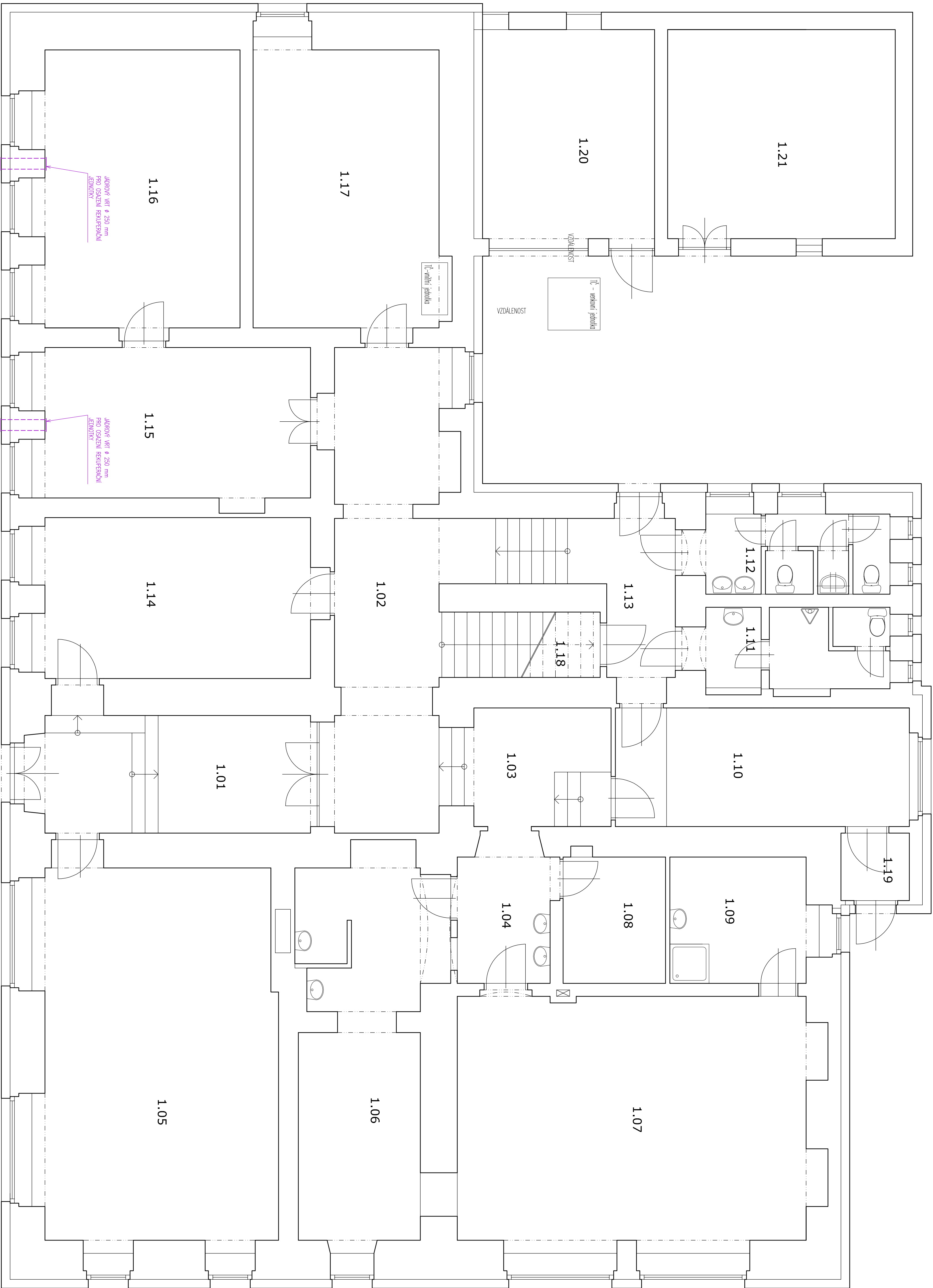
LEGENDA MÍSTNOSTÍ PŘÍZEMÍ: